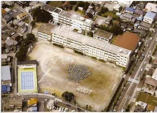
上空から見た学校全景