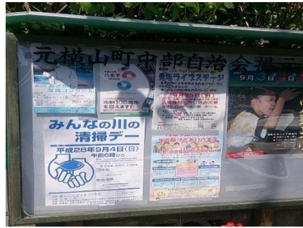
元横中部町会 町会掲示板