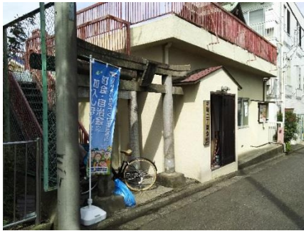
寺町二丁目町会 稲荷会館

町自連加盟の356団体における地域での「のぼり旗」「ポスター」の掲出、「チラシ」による加入勧奨を実施