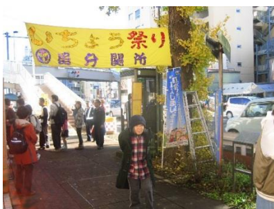
追分町会 追分関所