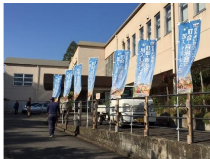
公共施設 加住市民センター