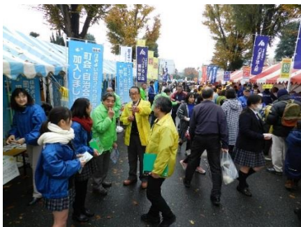
町自連特設ブース