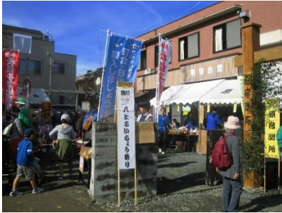
原宿町会 原宿関所