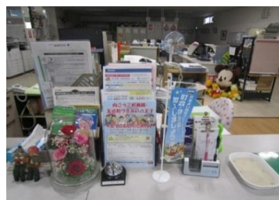
全日本不動産協会東京都本部多摩南支部