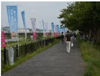
西部第二地区 ふるさと川まつり