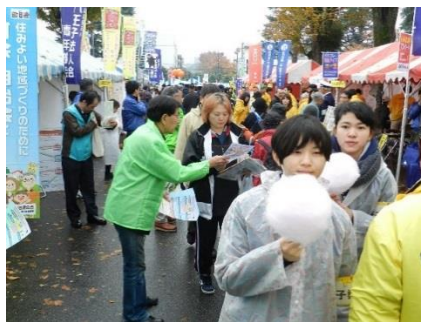
加入促進チラシ配布