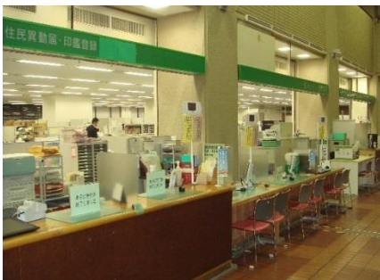
公共施設 市役所市民課窓口