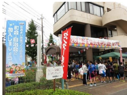
東南部地区 子安市民センターまつり