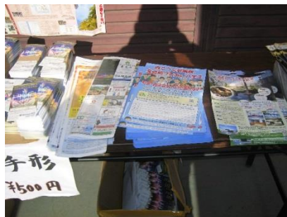
追分関所 チラシ配布