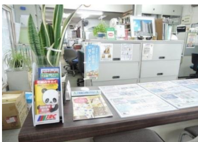
東京都宅地建物取引業協会八王子支部

市内の不動産関連団体支部約500社の窓口での「卓上のぼり旗」「ポスター」の掲出、「チラシ」の配布を実施