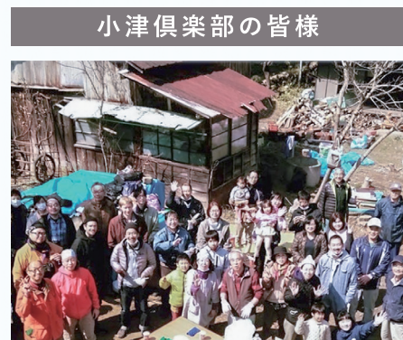
小津倶楽部の皆様

再生した古民家を拠点に、地域の豊かな自然環境を活かした農作物の収穫体験などのイベントを実施し、町の魅力を発信することで、地域の活性化に取り組んでいます。