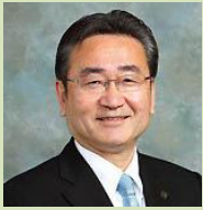
石森 孝志 市長