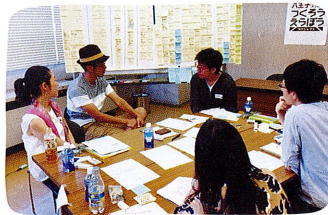
「八王子で幸せになるストーリー」をテーマにアイデアを出し合いました。