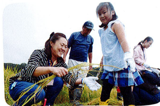
ときには八王子の農業や産業を体験するツアーにも出かけてまちの魅力を探ります。