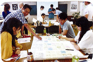
2018年8月から公募市民によるワークショップがスタート。

八王子のブランドメッセージは、つくるのも、えらぶのも市民。 市民ワークショップで4つのブランドメッセージ案をつくり、 総選挙で集まった25,000票をもとに 「あなたのみちを、あるけるまち。」に決めました。