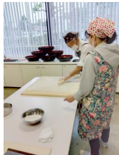
先生の手助けにより 均一に四角く伸ばします