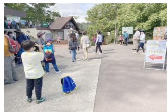
ケーブルカー終点付近