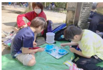
いっぱい汗かいたから かき氷がおいしいね