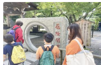
なにか良いことがありますように