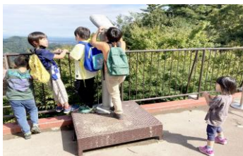
ぼくの家みえるかな？

去年の秋、9月25日(日)晴天のなか「高尾山ウォークラリー」を行いました。14世帯中、3世帯での開催でしたが、天気にも恵まれ楽しく汗をかきながら登山することができました。