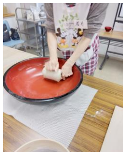
腰を入れて130回以上 こねます、これが肝心!!