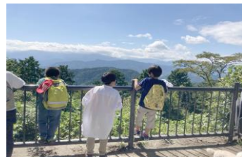
富士山 見えるかな？