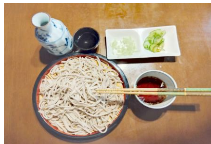
出来上がりで一献.....至福のひと時です