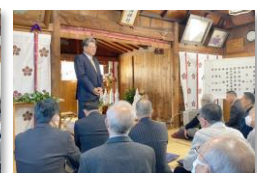
萩生田衆議院議員