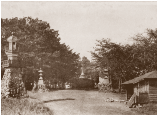
戦没者の魂を祈る「招魂社」と呼ばれたあたり(明治40年ごろ)

大戦の八王子大空襲では、人々が逃げ惑う「地獄」になりました。1965年には、高さ20mの「八王子市慰霊塔」が建てられ、西南戦争から太平洋戦争までの3248名の氏名が刻まれています