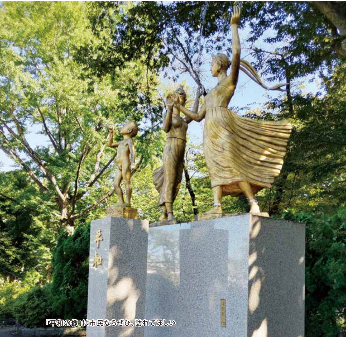
「平和の像」は市民ならぜひ、訪れてほしい