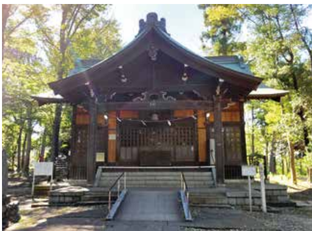
「富士森」の名前の由来となった浅間神社

ここが公園として整備されたのは、1896年(明治29年)です。その成立時から西南戦争・日清戦争戦没軍人・兵士の碑ほか、戦争で亡くなった方を偲ぶ碑を建てるのが目的とされてきました。1906年には日露戦争戦死者の碑が建てられます。このように富士森公園は10年から15年ごとに起こる戦争戦死者を慰霊する「招魂社」でした。その招魂社は第二次世界