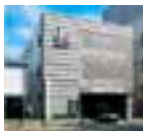
八王子総合斎場 八王子駅南口より徒歩約5分