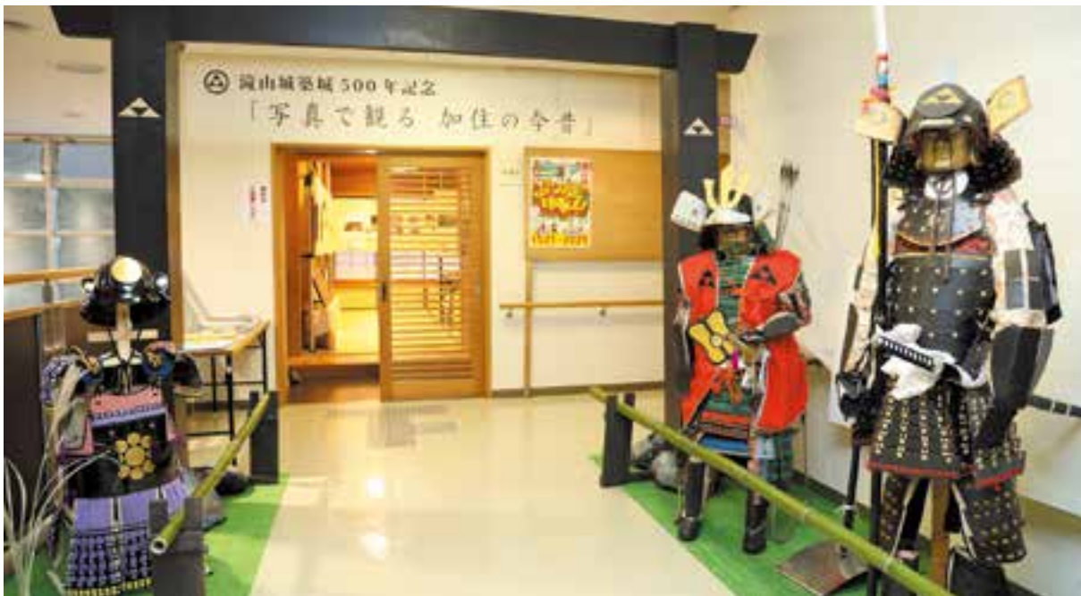
甲冑を飾ってみました、勇ましいですね。