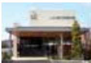
南大沢総合式場 南大沢駅より徒歩約9分