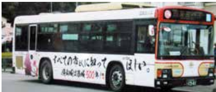
築城500年記念バスが走りました。

地域が誇る、滝山城跡は、昨年築城五百年を迎え、二〇一七年に続日本百名城に指定され、さらに、二〇二一年に東京都として初めての日本遺産（構成文化財の一つ）として認定されました。同年三月には、八王子市長はじめ、多くのご来賓をお迎えし、滝山城築城五百年記念式典を開催しました。また、地域の有志の方々のご支援、ご協力により、滝山城築城五百年記念碑を建立、これを八王子市に寄贈いたしました。さらに、八王子市観光課との協力に