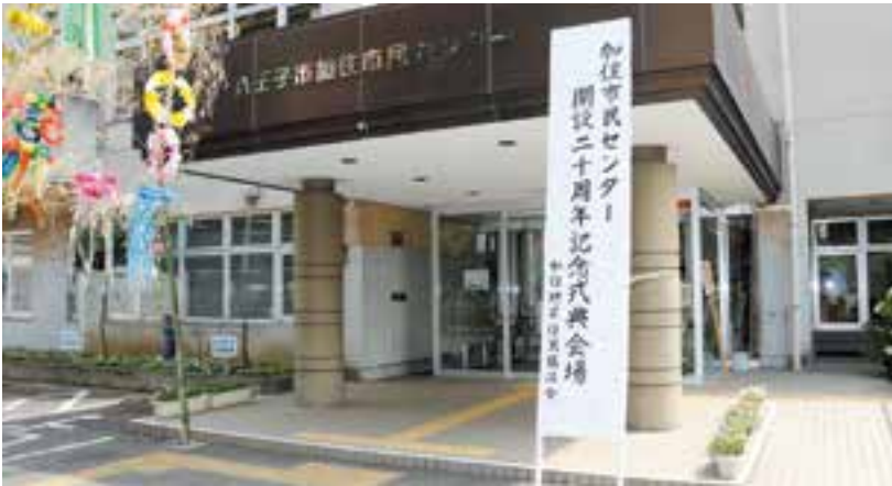
式典とともに七夕飾りの準備も整いました。