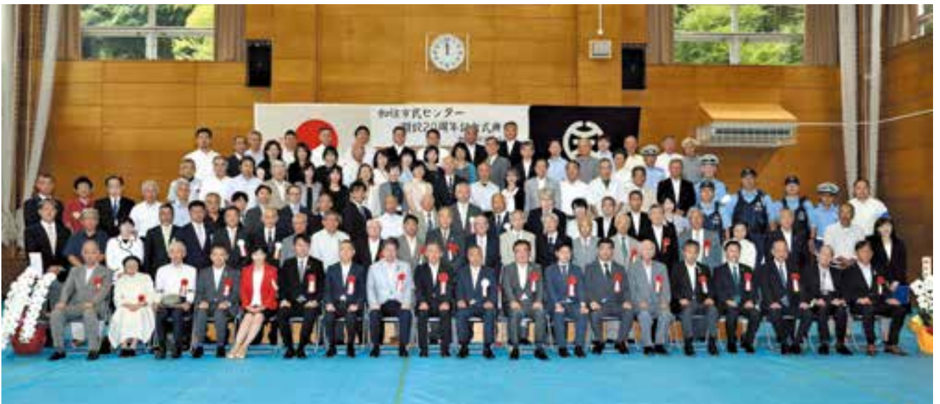
20周年式典ご来賓の方々を中心にスタッフ一同