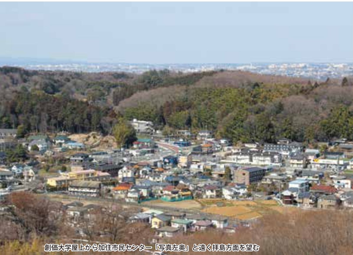
創価大学屋上から加住市民センター「写真左奥」と遠く拝島方面を望む