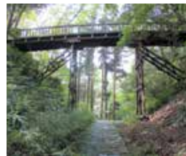
深い堀切にかかる引橋（滝山城跡）