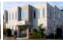
八王子北野セシモコーホーム 北野駅北口より徒歩約5分