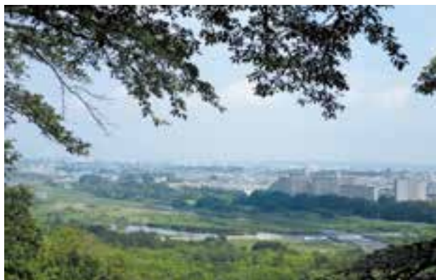
滝山城跡中の丸から多摩川、狭山丘陵が見晴らせる