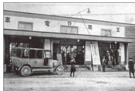
大正14年開設されたばかりの玉南電車・東八王子駅