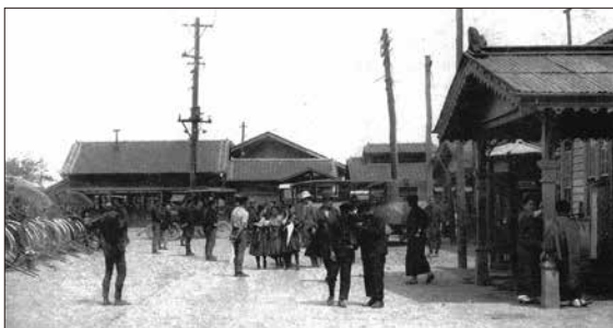
2代目八王子駅 大正時代