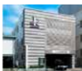
所在地 八王子総合斎場