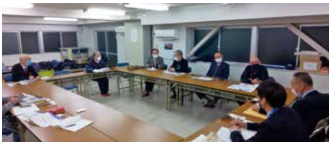
市役所とのディスカッション風景

この機会に合わせて、先日、このエリアの自治会長と市役所の担当課長とのディスカッションが実現しました。皆さん、盛んなご意見を交わしていたと同時に、このまちづくりに関して、非常な期待を持っていくことを確認しました。