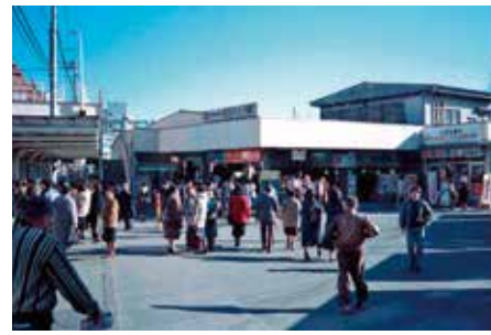
北野駅方面に約200m移転し京王八王子駅に昭和61年ごろの風景

在していました。JRと同じく、空襲により焼失、再建、昭和38年八王子市の都市計画で開設された東放射線道路沿いに移転、駅名も京王八王子駅②になりました。その後地下化されますが、今でも地上の京王八王子駅の風景を懐かしむ方々も多いです。