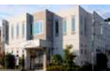
所在地 家族葬専用式場