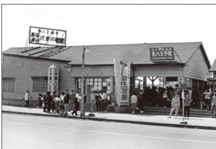
昭和37年の東八王子駅

一方の京王八王子駅は、大正14年、玉南電気鉄道開通の際に、東八王子駅①として明神町の甲州街道沿いに位置してました。その頃の明神町はまだ田んぼが多く、甲州街道沿いに農家と商店が混