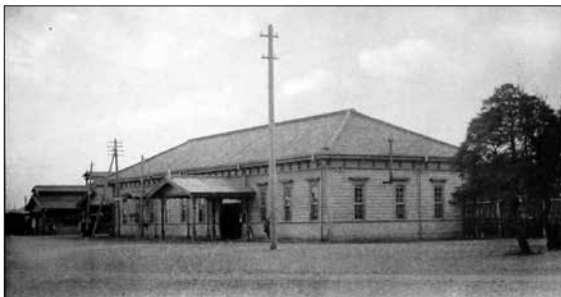
初代八王子駅の絵葉書。明治後半か

まず、JR。今回トップで取り上げた「東京たま未來メッセ」が立つ場所には、なんと現在のJR、当時は甲武鉄道と呼ばれた路線が