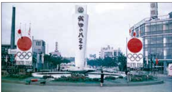
昭和39年の八王子駅前

通り、そこには、「初代八王子駅」①がありました。そして、その当時は機関車だったため、折り返しの広いスペースが必要。そのため、初代八王子駅の先にしばらく線路が続き、現在のクリエイトホールあたりに折り返し所があったとされます。そして、明治34年に官線中央線の八王子-上野原間が開通、それにつなぐために八王子駅は現在の陸橋寄りの場所②に移ります。昭和13年には大改装が行われま