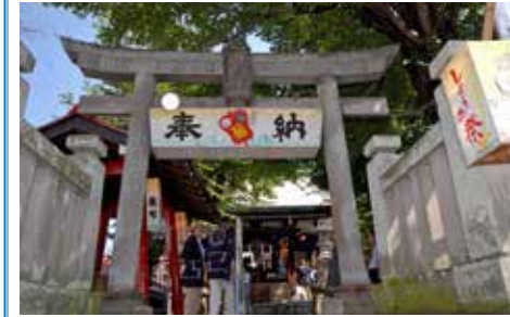
「永福稲荷神社」新町町会が主催します

東部エリアには、「行ってみたい」神社が3つあります。まず子安神社。3月のきつね祭、9月の泣き相撲など年間多くの行事が行われていますが、今では「御朱印巡り」の地として有名です。次に永福稲荷神社。地元産のしょうがを露店で売る9月の「しょうがまつり」で知られています。これは新町町会が主催します。次は11月のお酉さまで知られる、市守大鳥神社。商売繁盛を願って、多摩地区全体から人が訪れます。