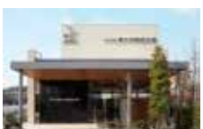
所在地 南大沢総合式場