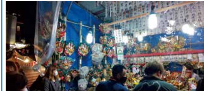
「市守大鳥神社」お酉さまには多くの方が

※新型コロナウイルスの影響により、それぞれのイベントは縮小される可能性があります。