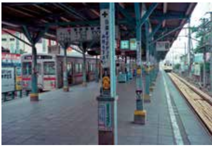
懐かしの地上の京王八王子駅風景