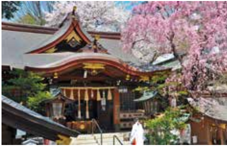
「子安神社」桜の花の見事さでも有名です