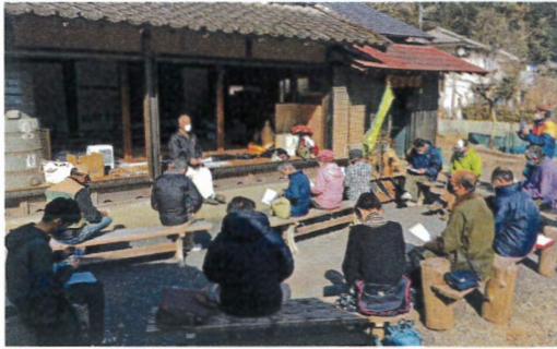
小津倶楽部の拠点古民家「おもむろ」の前でミーティング中

恩方の「まちづくり」の先駆者と言えるのが、2017年から始まった「小津倶楽部」の取組です。過疎化が進む小津地域を活性化させ、豊かな里山を守るべく活動しているNPO法人です。町内の古民家を改装し、耕作放棄された畑や山を皆で再生し、野菜を作ったり木材を加工したり、地域の資源を活用した様々なイベントを