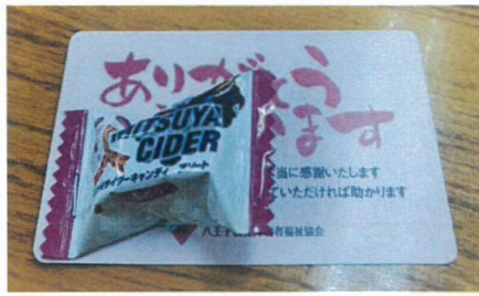
「ありがとうカード」あなたも集めませんか？

相変わらず、視覚障害者の方がホームから落ちる事件は後を絶ちません。そのニュースに触れるたびに「どれほど怖かっただろう」と、胸が締め付けられる思いがします。ところが、私たちのちよつとした気遣いで、その「視覚障害者の恐怖」はなくなっていくます。