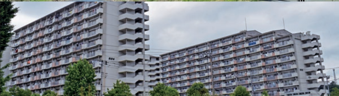
上「長房ふれあい端午祭り」の鯉のぼりの景色は壮大（令和元年開催時） 下 町会自治会団体数45を数える横山北地区