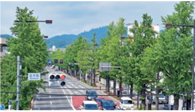
初夏の並木町のいちょう並木の景色