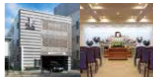
八王子総合斎場 「八王子駅」南口より徒歩約5分