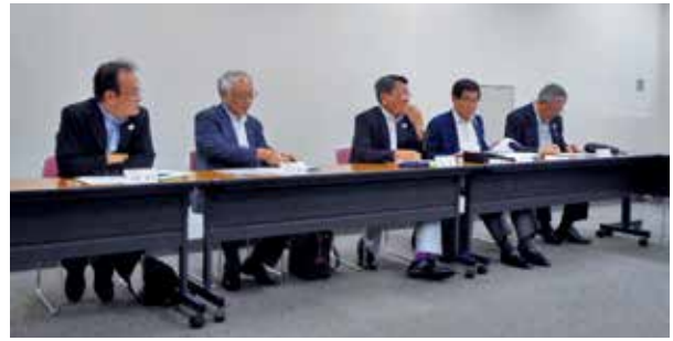
当日の懇談会の様子

定例の市長と町自連三役との懇談会が、7/17(水)に市役所において、開催されました。