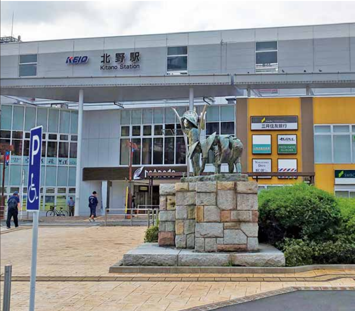
現在の北野駅前の風景

今回は北野地区。大正14年に開通した京王線（当時、玉南電気鉄道）は長沼駅、北野駅と続く八王子市の東の玄関口にあたるエリアです。とくに北野駅は、いまや、高尾山エリアや京王八王子エリアにつながるターミナル駅になっており、独自の発展を遂げています。「北野周辺なら何でも揃う」が、この地区の強みともいえます。