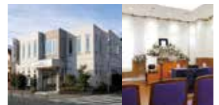
八王子北野セレモニーホーム 「北野駅」北口より徒歩約5分