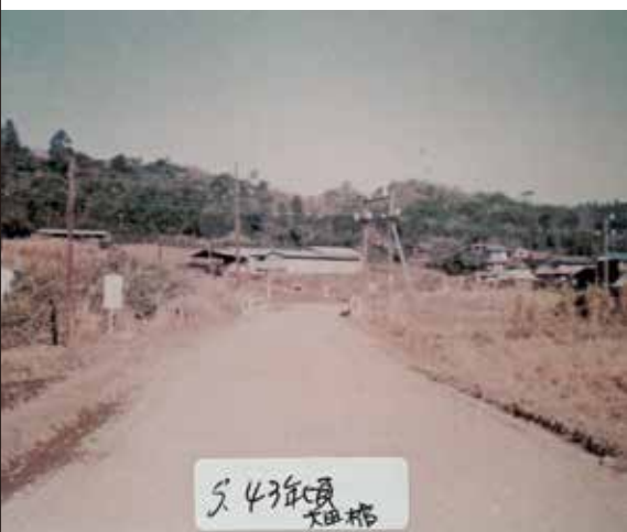
昭和43年ごろの大田橋あたり（南大沢）