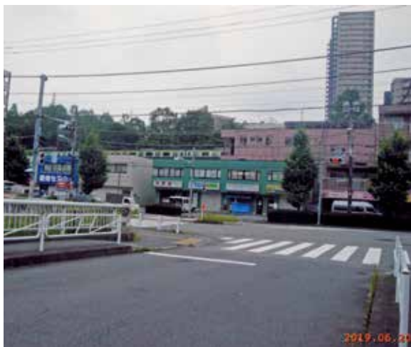
上記の現在。山の斜面に京王線が走る

由木地区。八王子の東部に位置することは、北は日野市、東は多摩市、南は町田市と接しています。江戸時代には、大塚村、中野村、堀之内村、越野村、松木村、大沢村、下柚木村、上柚木村、中山村、鎌水村別所村の11カ村に分かれていました。明治22年の市制・町村制施行に伴って合併し由木村に。昭和39年8月1日には八王子市に合併します。その際、八王子市合併派と日野市合併派に分かれ、大論争になったといいますが、それも「由木村」の郷土愛の強さの表れでしょう。それだけに、町会自治会の活動も非常に活発ですし、P2からの対談にも表れているように、町会活動への新しい意見も画期的なものがあります。