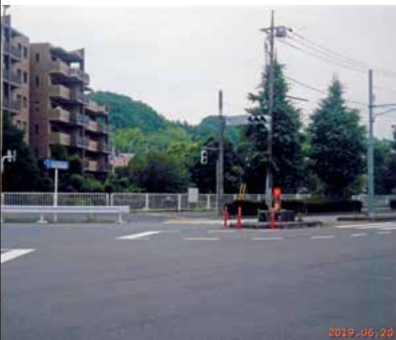
現在の大田橋付近