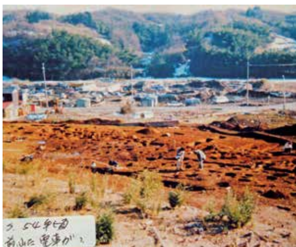
昭和54年ごろの日向地区（南大沢）。手前では古墳発掘が