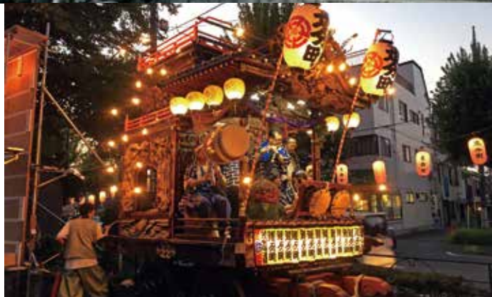
祭り好きが多い地区です（写真は追分町の山車）