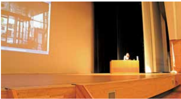
リアルな国崎講師のお話にご来場者も聞き入っていました