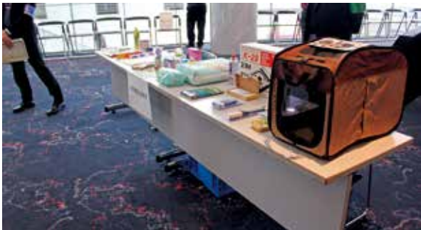
緊急時備蓄品も展示され、とても勉強になるものでした