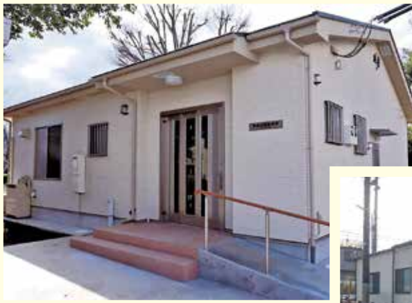
2月9日にオープンした「散田公園集会所」