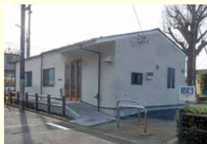
2月23日にオープンした「小門公園ホール」

散田町の散田公園に2月9日、そして、小門町の小門公園に2月23日、待望の町会会館がオープンしました。当日は、市長や地域の皆さんの参加で、それぞれ落成式が行われました。現在、土地の確保が難しいため、町会会館、自治会会館を持たない町会、自治会が約