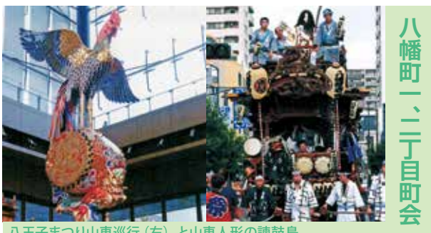
八幡町一、二丁目町会