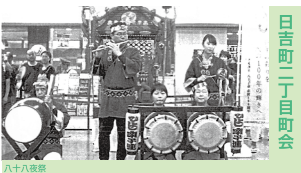
日吉町二丁目町会