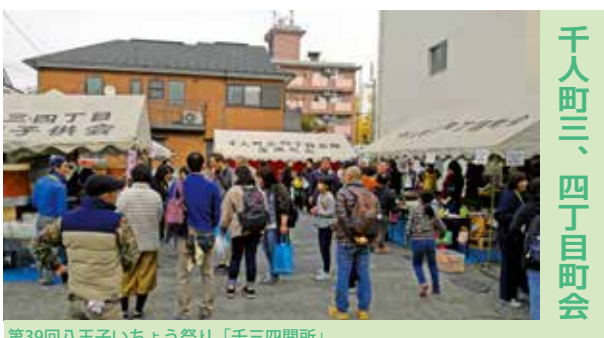
千人町三、四丁目町会