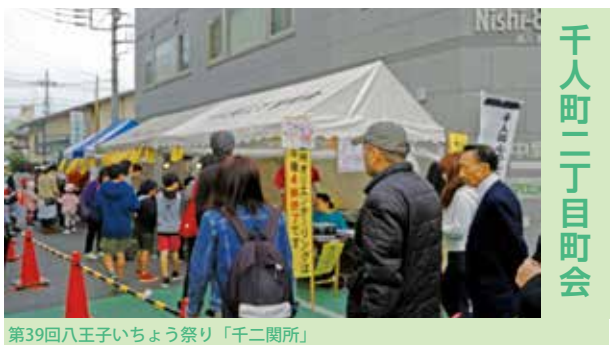
千人町二丁目町会