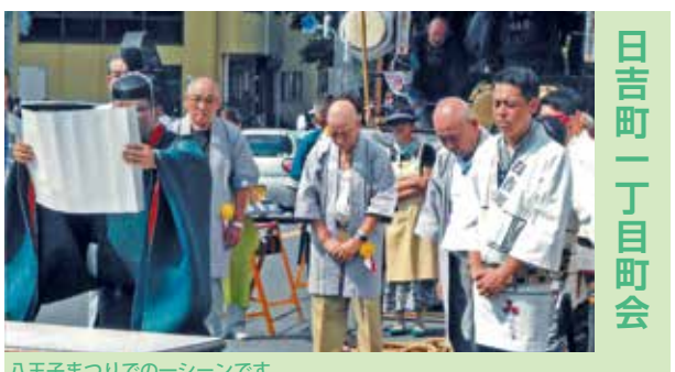
日吉町一丁目町会