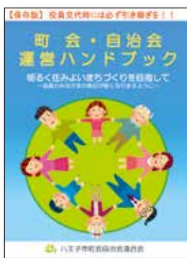
「平成30年度 東京都地域の底力 発展事業助成」対象事業

町自連では、市の協力を得て、町会・自治会の運営に役立てていただくため、「町会・自治会運営ハンドブック(改訂版)」を作成しました。運営ハンドブックは、A4版サイズの冊子で、町会役員の運営の目安として利用していただくとともに、役員交代時にはその役員に必ず引き継いでください。