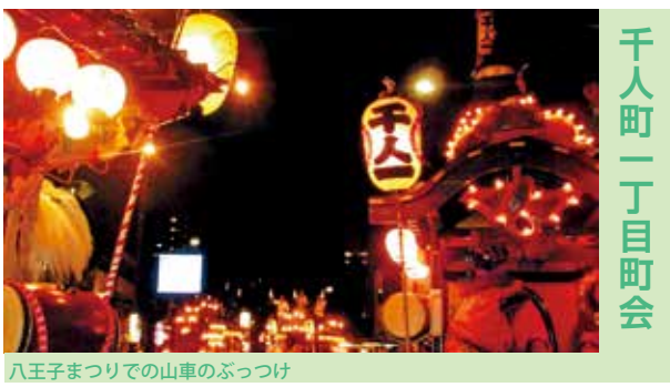
千人町一丁目町会