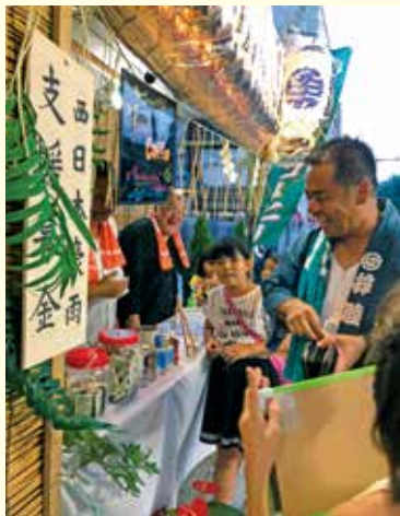
皆さん、募金をありがとう

全国的に災害が続いたこの夏、お祭りや 様々な会合で募金活動が行われました。写 真は、八王子神輿愛好会 桑都勇會の皆様 の八王子まつりにおける募金風景です。募 金は町自連に託されました。