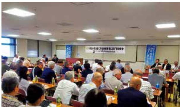
皆さん熱心に聞いていらっしゃいました

9月1日(土)に市役所において、「町会自治会に係る財産管理に関する研修会」が開催されました。当日は、萩生田衆議院議員から地域のきずな、総務省職員から認可地縁団体制度について講演をいただきました。