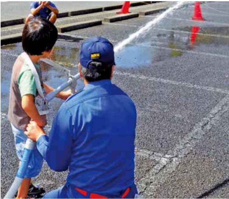
消防団第2分団による放水訓練