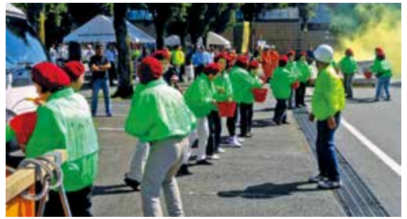
女性防火協会によるバケツリレー訓練