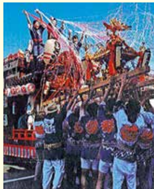
お祭りは親子連れでにぎわいました

第45回めじろ台祭り(1丁目く 4丁目合同主催)は、7月14日(土)、 15日(日)に京王線めじろ台駅前 広場およびめじろ台町内で執り行 われました。めじろ台3丁目町会は、 例年通り神酒所を開設し参加しま