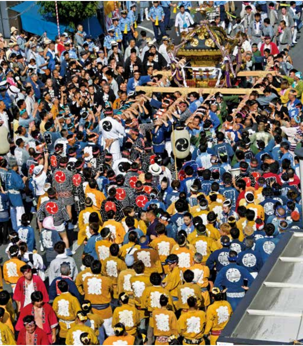
多賀神社の千貫神輿(八王子まつりにて)

国土豊穡、万世安穩を祈願するため、滋賀県多賀大社から分祀したといわれています。西暦1738年には、