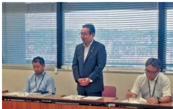
当日の市長の写真です