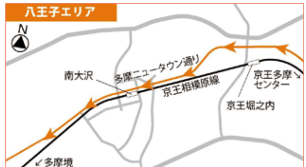
自転車ロードレース・八王子エリア

東京2020オリンピック競技大会における自転車ロードレース(男子・女子)のコース決定の発表が8/9(木)にありました。八王子市内、多摩ニュータウン通り約5.1kmを通ることになりました。