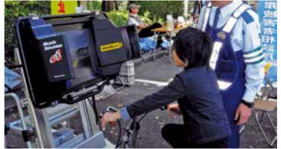
最新機器を使った自転車安全教室