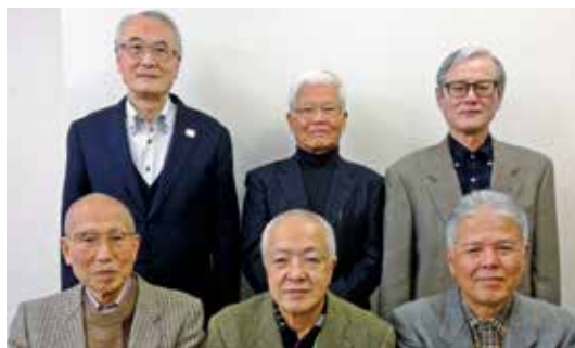
座談会出席者(敬称略)