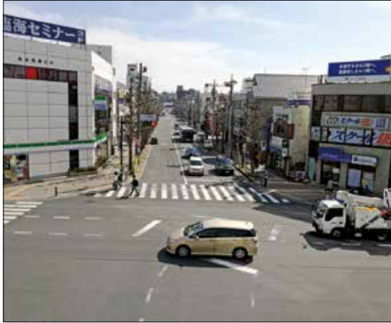
現在のとちの木通り坂の下からの風景