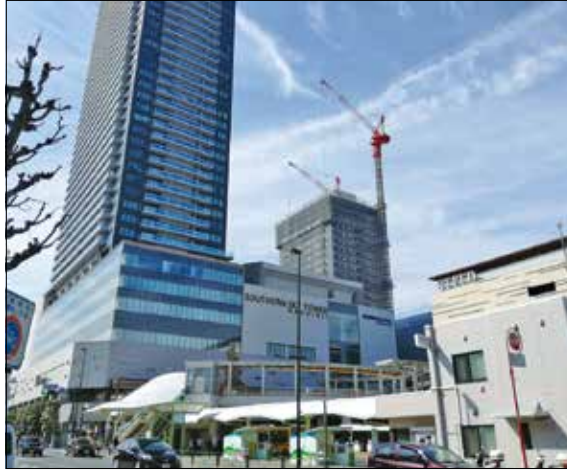
再開発が進みつつある南口