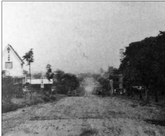
昭和30年代初期のとちの木通り坂の上からの風景