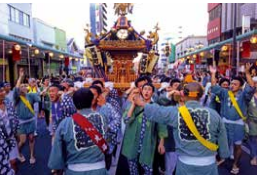
天神町は神輿を担ぐ