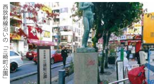
西放射線沿いの「三崎町公園」

当町会は、中部地区連合会の中でも八王子駅寄りにあり、西放射線道路と交差する富士見通りの南側、JR中央線の線路沿いにある。 町の成り立ちはかなり古く、明治43年八王子町発行の「八王子町全図」に「字三崎町」の文字が見られる。しかし、海辺でもないのになぜ、「三崎町」という町名になっているのには不明である。三崎町という名称になる以前は、「馬乗(うまのり)」と称していた。これは江戸時代に、現在の小門町辺りに幕府の代官屋敷が置かれ、三崎町、中町、南町、東町の