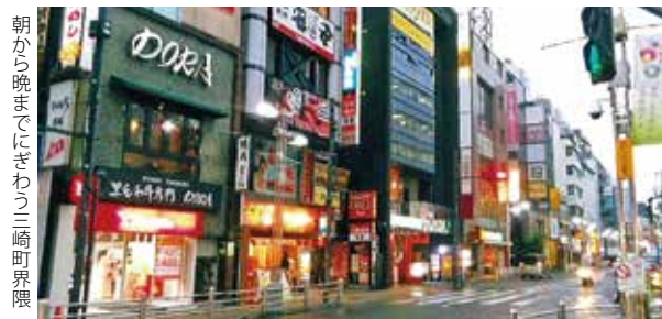
朝から晩までにぎわう三崎町界隈

当町会は、中部地区連合会の中でも八王子駅寄りにあり、西放射線道路と交差する富士見通りの南側、JR中央線の線路沿いにある。 町の成り立ちはかなり古く、明治43年八王子町発行の「八王子町全図」に「字三崎町」の文字が見られる。しかし、海辺でもないのになぜ、「三崎町」という町名になっているのには不明である。三崎町という名称になる以前は、「馬乗(うまのり)」と称していた。これは江戸時代に、現在の小門町辺りに幕府の代官屋敷が置かれ、三崎町、中町、南町、東町の