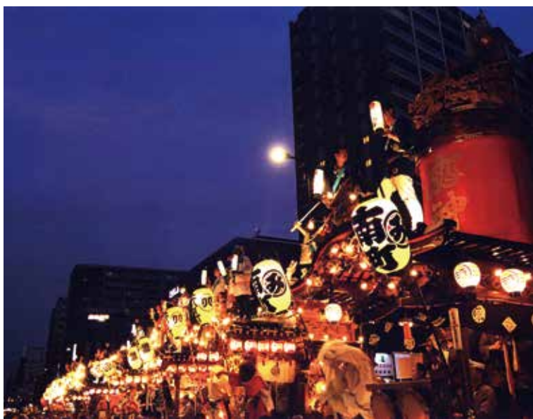
八王子祭りのクライマックスの風景

成した祭礼の山車を平成26年には、文化庁の補助を受けて創建当時の一本柱後ろだて人形山車に復元した。人口892人、世帯数595（単身世帯を含む）。町の面積は3万6千㎡と八王子市内199町の中で、3番目の狭さでありながら、江戸時代より祭礼を脈々と続けられてきているのは、町衆の心意気以外の何物でもない。