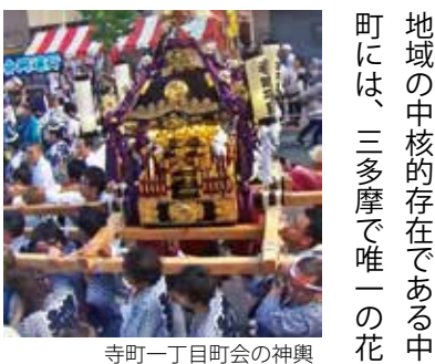
寺町一丁目町会の神輿

今回の地域は、八王子駅北口からJR中央線の線路に沿って隣接する七つの町の連合会である。連合会長の町会長はよく、「男は仕事と家庭を大事にする。それだけじゃあダメなんだ。もう一つ、町を大事にして、初めて男になるんだよ」と父親に言われたという。祖父、父親、と三代で町会長を務める。そんな「代々、この地で生き、町を守ってきた」七人の男が