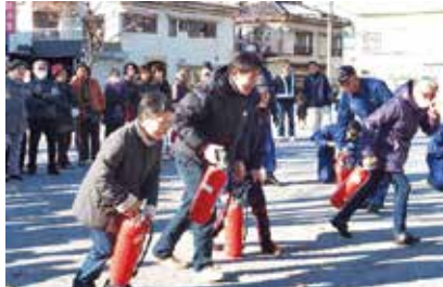
毎年11月の「防災避難訓練」。約70人の参加があります