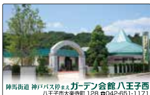
陣馬街道 神戸バス停 ガーデン会館 八王子西 八王子市大葉寺町128 ☎042-651-1711