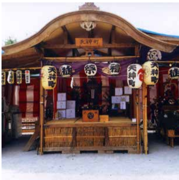
市内では珍しい御飯屋

この伝統ある町を引き継いでいくため町会各部、子ども育成会、明和会が一致団結し、様々な活動を通して次の世代に託しています。春には新入学生お祝い餅つき大会を、夏には天神公園に市内では珍しい御飯屋を設営しお祭りを盛大に行い、秋には第三地区運動会に老若男女が参加し、昨年も優勝という素晴らしい成績を勝ち取った。