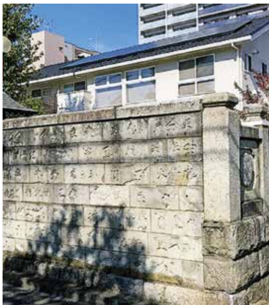
ぜひ訪れたい不動尊