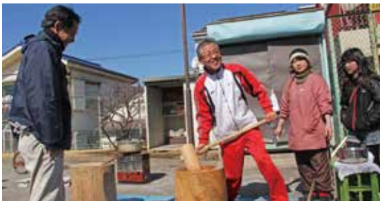
毎年2月餅つき大会

私たち町会は、八王子駅の南口から徒歩5分に位置する280世帯の町会である。町会の理事は、地区から選出された役員さんとともに老人会会長、子供会会長、民生委員で構成され、諸々の年間行事（餅つき大会、夏祭り、敬老会、運動会、防災訓練等々）を子供からお年寄りまでが一緒に仲良く協力して行っている。また、新しく来られた方（特にマンションの方々）も積極的に町会行事に参加され、理事役員の構成も40%を超え、全域で仲良しな町会である。