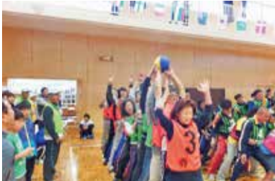
毎年10月の「大運動会」。昨年は83名が参加

私たち町会は、八王子駅の南口から徒歩5分に位置する280世帯の町会である。町会の理事は、地区から選出された役員さんとともに老人会会長、子供会会長、民生委員で構成され、諸々の年間行事（餅つき大会、夏祭り、敬老会、運動会、防災訓練等々）を子供からお年寄りまでが一緒に仲良く協力して行っている。また、新しく来られた方（特にマンションの方々）も積極的に町会行事に参加され、理事役員の構成も40%を超え、全域で仲良しな町会である。