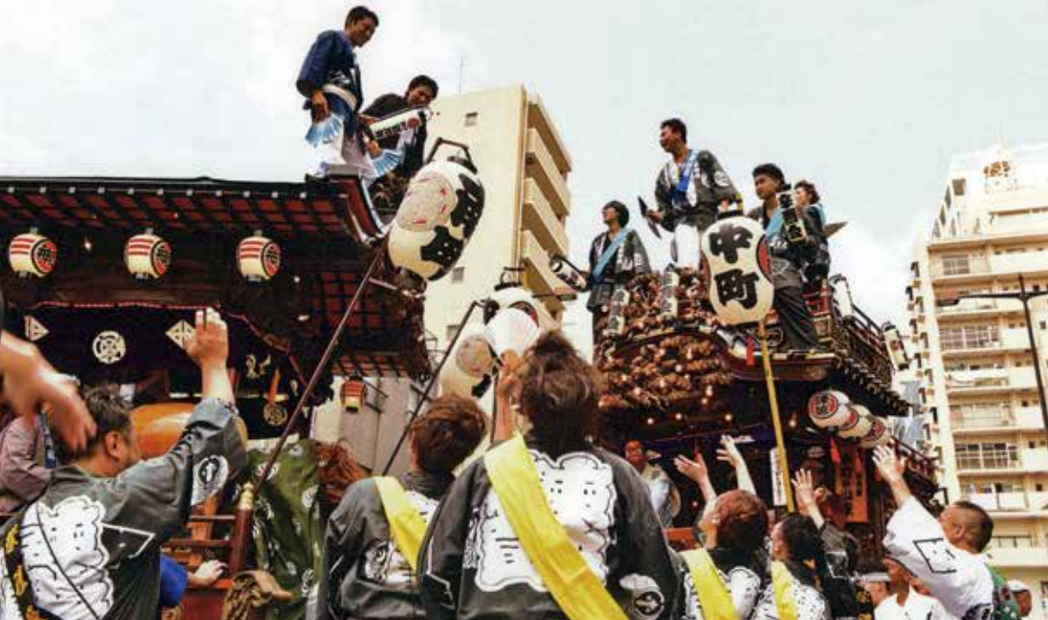
中町と南町の山車のぶっつけ (八王子まつりより)