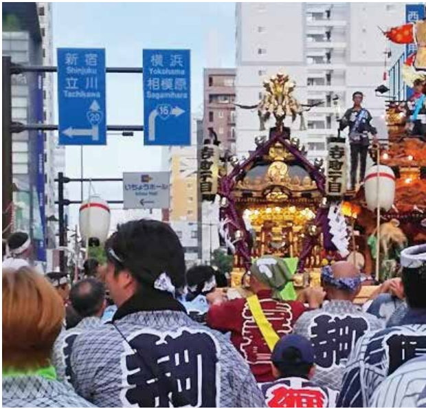
八王子まつりでの寺町一丁目の神輿

江戸期の元禄の時代より続くわが町、寺町は八王子駅近くにあり、南北には国道16号が通る。 子供の頃は、路地で三角ベースボールやビー玉で遊び、隣町からは三味線の音色が聞こえた、小粋な町であった。今では駅近の事もあり高層マンションが建ち、家並みもまばらになり空き地はコインパーキングに。それでも町会員の皆さんは町会活動に積極的に参加。防犯パトロールは平成10年頃より本格活動し町内回りから八王子