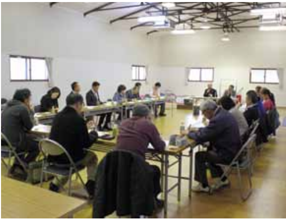
美山学園施設「やまゆりホール」に皆さんが集まりました