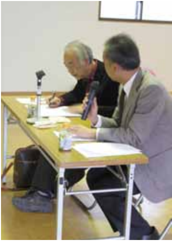
荒井町会長(左)の司会進行で会は進みます

前回取り上げた「八王子平和の家」は、八王子市美山町にあります。今回は、その美山町の取り組みをご紹介します。美山町は、八王子の西部地区に位置し、屈指の自然と眺望に恵まれた環境です。また、住む人