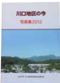
「川口地区の今」は非売品ですが、市内の図書館などで読めます

今回は、川口地区町会・自治会連合会の特集です。このエリアは、明治22年に神奈川県南多摩郡川口村になり、同26年に東京府へ。そして、昭和30年に八王子市に編入されました。その川口パワーで、今でも団結力が強く、話し合いの場でも皆が活発に意見を交換する元気なエリアです。同時に、あふれんばかりの自然、そして、その中に、歴史的建造物や遺跡、文化的遺産がたくさんあり、研究すればするほど、奥が深いエリア