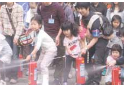
子供たちも懸命に防災訓練に参加