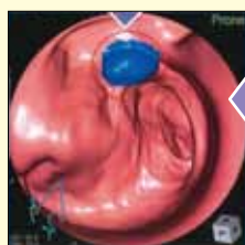
大腸全体の粘膜面をモニタ ーに表示し、異変をチェック