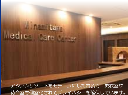
アジアリゾートをモチーフにした内装で、更衣室や待合室も個室化されてプライバシーを確保しています。