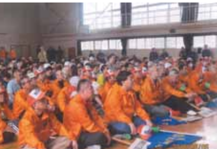
東部地区連合会自慢の防災訓練

今回は、JR八王子駅北口至近距離の「東部地区連合会」です。 いわゆる、織物のまち八王子の中心街だったところで、 メインの写真は、明治から大正にかけての甲州街道沿いです。 商売と祭りを中心に成り立ってきた街ですが、今やマンションも増え、 子供たちも増えてきました。一番の自慢は、このエリア全町参加の 「防災訓練」。八王子の都会ではありますが、団結力は負けません