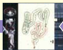
ザイオステーションで ①データ解析GO ②大腸を3D自動抽出