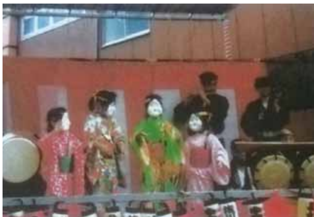
毎年の居囃子の舞台は、三井住友銀行駐車場に設置されます

旭町は、八王子駅を含む周辺のエリアです。再開発で、住人が減ってきたエリアでもあります。今も実際に住んでいる人は非常に少ないです。東部地区連合会の1年に1回の防災訓練は綿密な打ち合わせの中、実施されるもので、この地区の中心行事だと思います。また町会では、八王子まつりには、北口商店会と共催で舞台を作り、居囃子を行います。また、駅周辺の防犯活動にも積極的に取り組んでいます。