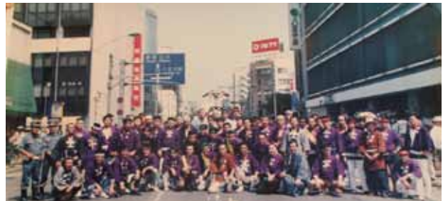
約20年前の八王子まつりにて。駅前風景も変わりました

当町会は駅近くに位置し防犯防災には非常に気を使っていますし、日頃の訓練も怠っていません。昨年10月には、自主防災訓練を八王子消防署員の皆様と消火訓練およびAED 取り扱いの講義を受けました。3月には八王子警察署員さんにきていただき、防犯講演会もしています。地域の交流としては、町内祭りが8月8日、9日、大島神社境内において行われ、300名以上が参加。結束力では、他に引けを取らないという自信があります。