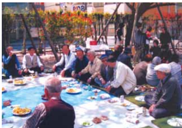
たくさんの町会員が集まるお花見の会

わが町会は、春にはお花見の会、夏には子安神社の町内祭礼、秋には敬老事業として、75歳以上の高齢者にお赤飯を配り、長寿をたたえています。凶悪事件も増えていることから、毎月1回、パトロール隊を結成し、町内警戒パトロールも実施しています。最も成果を上げているのが、東部地区連合会700名が集まる、防災訓練でしょう。これは、新町、東町、旭町を含めた防災訓練で、今では東部地区連合会が全市に誇れる行事です。