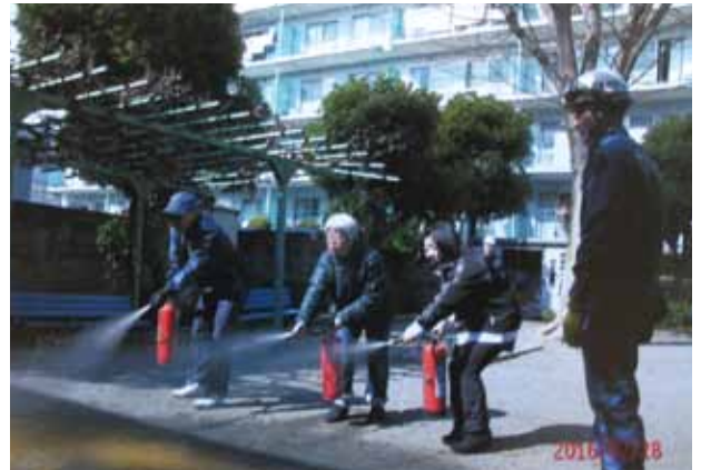
町会員の放水訓練の様子です

当町会は、大和田橋南詰の一带に位置し、800世帯で構成されています。近い将来大きな地震が起きるといわれて久しくたちます。町会では、防災訓練にもウェットを置き「自分たちの町は自分たちで守る」を合い言葉に、消防署、消防団の協力を得て災害時の救出救助や、消火栓を活用したスタンドパイプからの放水訓練も実施しています。また、災害時の要援護者を支える取り組みも進めており、自助共助を実践しております。