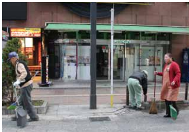
朝の掃除に励む東町の皆さん。若い方もご協力を！（取材者より）

東町は、現在住んでいるのは30世帯になり、テナントさんも入れて100会員ほどです。昔は商店街だったのですが、今はテナントビル街になりました。すべての方々の顔も存じ上げないのですが、皆さんもきれいな町を望んでいらっしゃると思います、少ない人数で毎朝6時半から掃除をしています。また、毎月1回土曜日19時半から防犯パトロールをしています。当初少人数だったのが、15人くらい集まるようになりました。