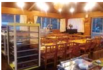
広々としたダイニングルーム