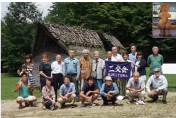
尖石縄文考古館 万治の石仏 諏訪大社下社春宮 片倉千人風呂 H.26.6.24.

当町会は270世帯ありますが、やはり八王子まつりを中心にみんなが仲良くなってきた歴史があります。マンションも増えたのでお子さんも多く、最近では子供神輿にも100人以上が参加してくれます。町会ができたのが大正末頃で、町内の全員が会員となるという意味で「二交会」と呼ばれ、1989年に『二交会のあゆみ』という本も出版されました。また、甲州街道沿いなので、商店会との共存共栄でやってきた町会でもあります。