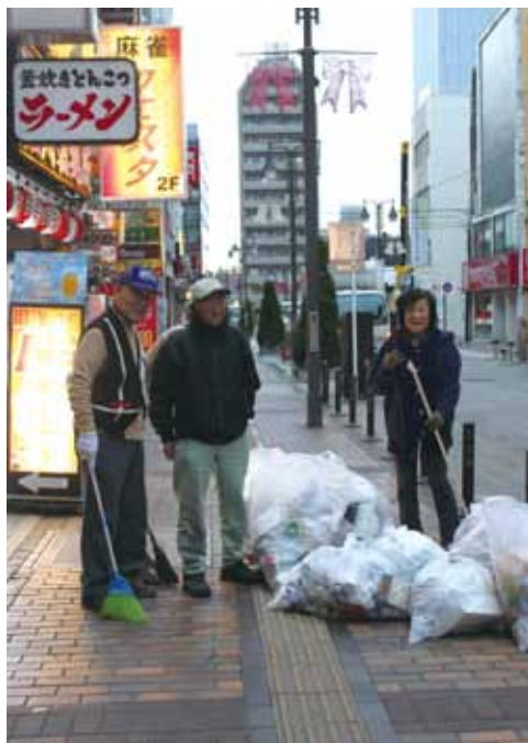
東町町会は約30世帯。 町会長ご夫婦自ら365日毎日町を掃除します