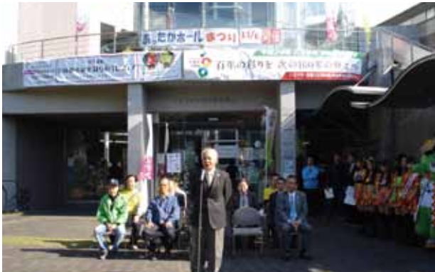
「あったかまつり」のオープニングにて

うちの町は、とにかくどんな行事も結束力が高いんです。年末の見回りだって、子供から大人まで3日間、たくさん参加するんですよ。子安神社の祭りはもちろんですが、第1回から町会挙げて力を入れている「あったかホールまつり」は、昨年で12回を迎えました。明神町一丁目町会、二丁目町会、大和田一丁目町会、北野町町会という4町会が協力してやるお祭りで、エコも訴えるし、フリーマーケットなどで楽しんでもらえるし、自慢の祭りに成長しました。