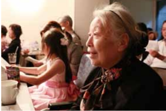
教え子の晴れ舞台を見て、目を輝かせる利用者さん

惑かけたくないから外出はやめます」と言った声なき声に数多く触れてきました。そして、医療や介護の現場にいなからその想いを聴くだけしかできない自分をもどかしく思ってきました。高齢者になったから、なぜ、外出をあきらめなくてはならないのか。外出や旅こそ、一番のリハビリじゃないか……。という