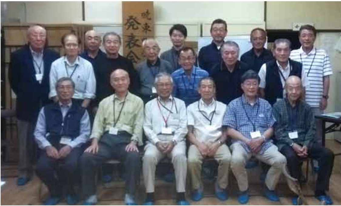
○各町会自治会町さんのお名前(敬称略)