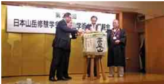
懇親会の鏡開きも大盛況