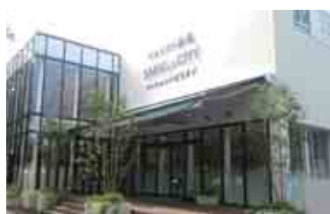
JR高尾駅北口から約3分の甲州街道沿いにモデルルームはあります

※A・B棟の第一期・第二期(全185戸)連続即日売れました。10月からはC・D棟(全231戸)の告知が開始予定です。