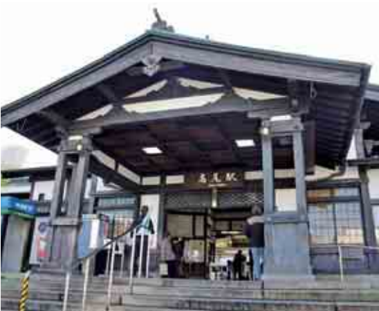
右上：運動会 右下：JR高尾駅北口 左上：多摩御陵への参道にかかる南浅川橋 左下：いちよう祭り