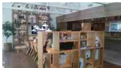
室内ではお茶もふるまわれます。つついし長居しちゃうそう

町として、子育てにはぴったりのエリアなのです。八王子町会自治会の皆さんも、ぜひ一度、モデルルームにお茶を飲みにいってみてください。新しい高尾を感じられるはずです。