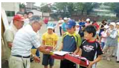
当日、最年少の参加者さん

さる9月5日（土）青少年対策ひよどり山地区委員会主催のグラウンドゴルフ大会がひよどり山中学校にて開催されました。地域のグラウンドゴルフファーターたちの熱心な指導のもと、子どもたちは、グラウンドゴルフを楽しみました。この大会では、地域のあらゆる年代が顔見知りになれ、地域の防犯対策には効果的な取り組みだと思えます。