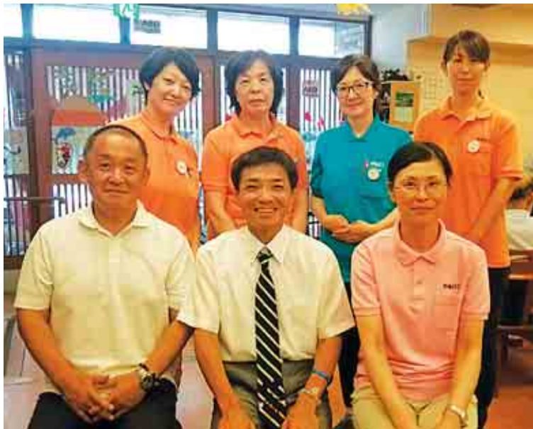
前列中央が君島社長。皆、元気!