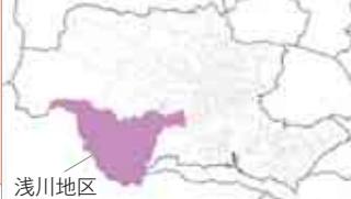
<浅川地区町会の区分け> ※住所区分と町会区分はイコールではありません