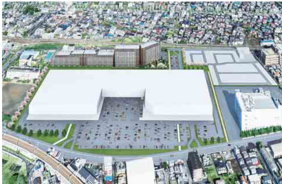
沖電気の跡地が、大きな町になります。子育てにぴったり

ね」という噂を耳にし、やってきました。高尾駅。高尾山がミシュランガイドの「日本の観光地」三つ星に選ばれた約6年前から、こ