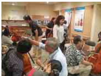
チェロ演奏体験も実施