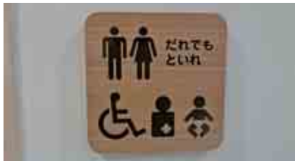
1階のトイレは町民も利用できる