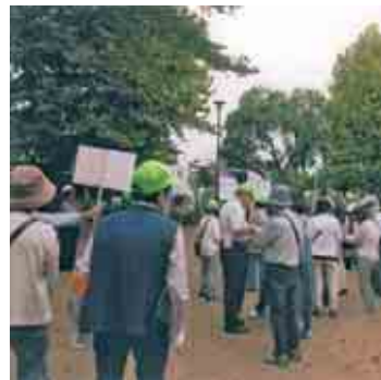
①9か所の避難場所に集合