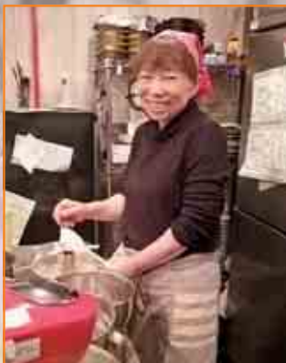
ケーキ好きが高じてオーナーに

※必ず、この町自連だよりをお持ちになって見せてください。ここにあげるサービスが受けられます。クーポンの有効期限は、平成27年7月15日までにあります。