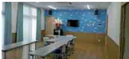
2階は放課後デイサービス事業に