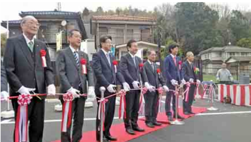
市長、大澤会長などが参列しテープカット

おりしも、全国的な「歴史ブーム」「城ブーム」が続いています。16世紀半ばの北条氏と滝山城の歴史は格好の観光資源です。八王子市民のみならず、市外からの観光客が増えることを願ってやみません。