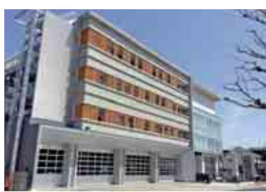
八王子消防署新庁舎