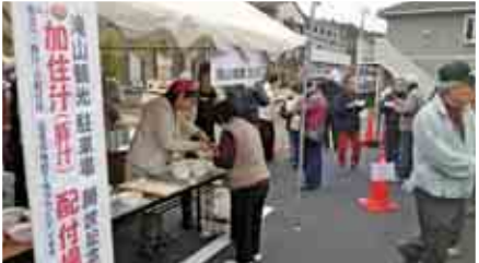
加住汁(豚汁)と甘酒がふるまわれる