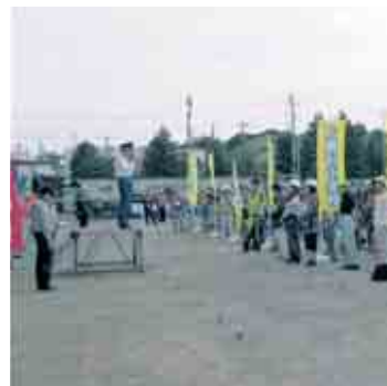
③小学校に到着、避難所別に整列