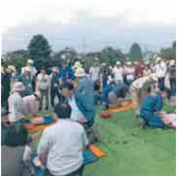
④心臓マッサージ訓練、AED訓練