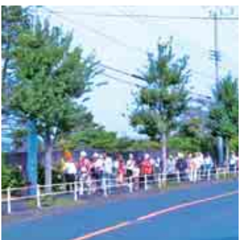
②小学校に向けて、誘導旗で移動