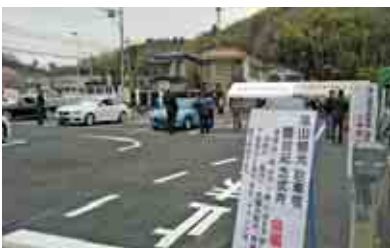
29台が駐車できます