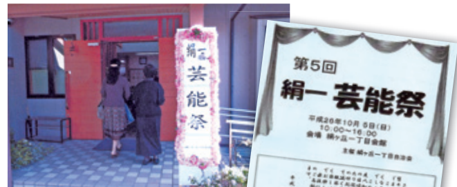
(上) お父さんたちのカラオケも素晴らしい！(中央) 合唱コーラスは、毎回大評判です(下) 入り口の装飾も手作り感いっぱい(右) プログラムも手作り。文章がいいですね