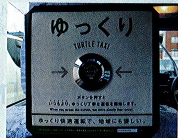
車内にある「ゆっくり」ボタン

7月下旬以降はさらに台数を増やしていく予定ということなので、見かけたら一度その快適な乗り心地を体験してみたいかが？