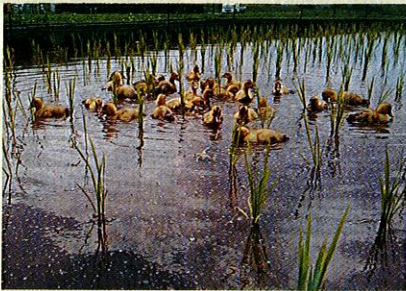
(上) 舛添都知事が「イベリコ豚よりおいしい！」と絶賛する TOKYO X (下) 合鴨農法でも米を作っている。水田の除草してくれるので減農薬になる