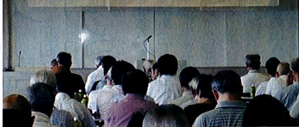
新任町会・自治会長及び役員研修会

今年度は少し趣を変え、役員活動について、提案と市の行政窓口になる担当所管の説明を聞くことができるよう、2部構成で研修が行われました。参加者からは多数の質問も出て、役員の方々の積極的な姿勢もうかがえました。学習としての成果は十分ではなかったかと感じています。