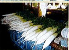
(上) 一面に広がる大根畑。立派な葉がついた大きな大根が、収穫を今か今かと