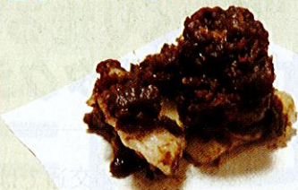
一番人気の「あんころ餅」

元々市内の農家のお嫁さん 元々市内の農家のお嫁さんの団体『プリンセスマーケット』や農協婦人部のメンバーだった4人で、道の駅オープンと同時に開店させた『はちまきや』。店名は4人の名前の一文字ずつを取って名づけたそうですが、現在はそのうちの3人で運営しています。