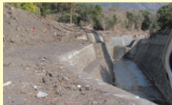
(下) がれきを処理した後。災害時はあたり一面ががれきで埋もれてしまっていた。