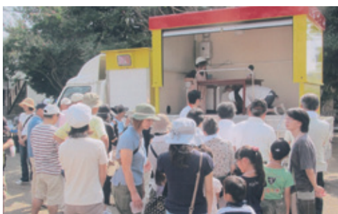
防災関連セミナーの様子

年度には防災訓練の実施、防災倉庫を設置し防災資機材の一括管理、出前講座を活用した防災関連セミナーの開催などを実施しました。活動では市役所、消防署、消防団、交通安全協会や町会の協力団体の方々からのご協力をいただきました。こうした取り組みの中、町会員のご夫妻が初期消火に貢献したことで八王