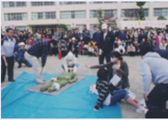
訓練は幅広い世代の住民が参加して行われた

訓練では家屋倒壊を想定した、初めての倒壊建物救助訓練と煙体験、通報訓練その他多くの種類の訓練を行いました。地域マンション住民が打ち合わせ段階より積極的に参加して、地元住民と計画を練りました。