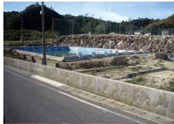
(上) いわき市内中学校に積み上げられた瓦礫 (下) 金山自治会との交流会の様子

交流会は町自連が事前に申し入れていた震災時に一番困ったこと、必要としたこと、連絡体制、情報収集、要援護者の支援、避難場所の設定、食糧・飲料水の確保をはじめ10数項目の質問事項に対して、担当者が個別に自治会としての取り組みを詳細にわたって説明されました。