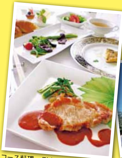
JR東日本 レストラン 「鳥居平」

身近な春を見つけたら、次は関東近郊の観光地に足をのぼしてみませんか？市内・近郊に営業所がある旅行代理店4社のスタッフのみなさんに、それぞれイチオシの“春ツアー”をご紹介します！