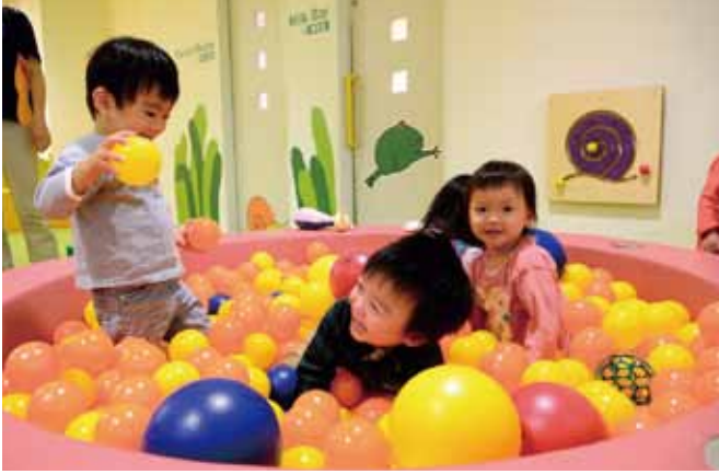
楽しい遊具がたくさん揃っている『ゆめきっず』