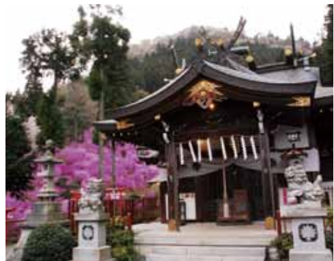
今熊神社とミツバツジ

1521年築城の「滝山城」は、北條氏照が八王子城に移るまでの間、20年以上居城していた場所です。現在の城跡が「滝山城址公園」となっていますが、ソメイヨシノや山桜などが約5,000本もあり、