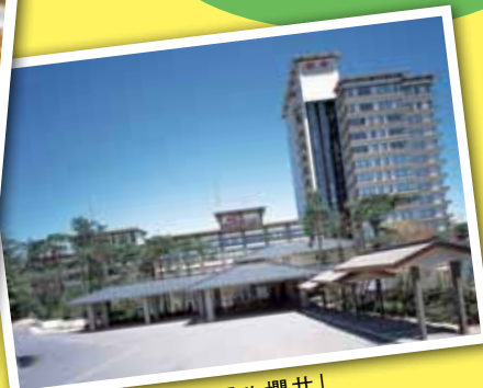
KNTツーリスト「ホテル櫻井」